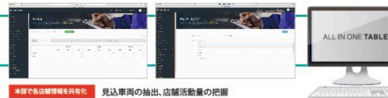
本部で各店舗情報を共有化 見込車両の抽出、店舗活動量の把握