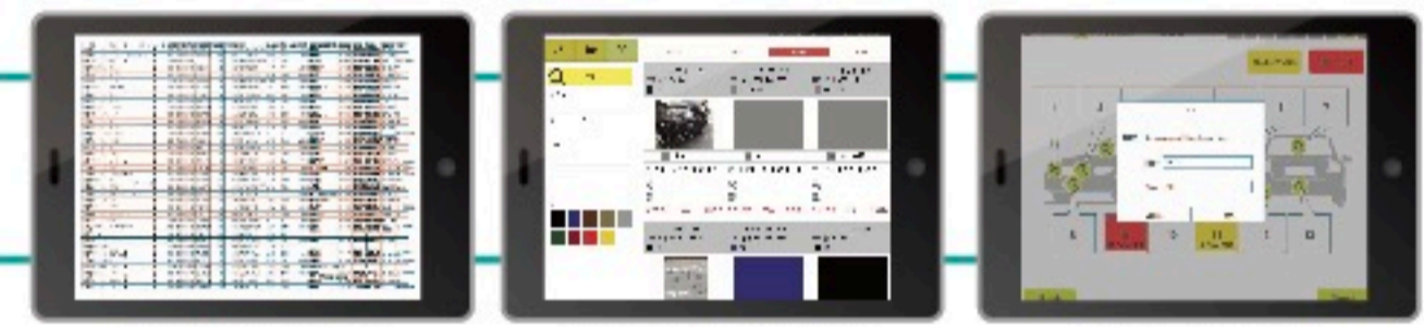
顧客情報の一元化 予約/作業状況の把握 車両状況の把握