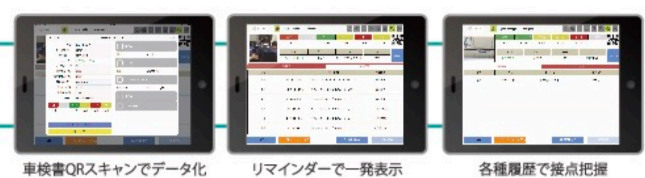
車検書QRスキャンでデータ化 リマインダーで一発表示 各種履歴で接点把握